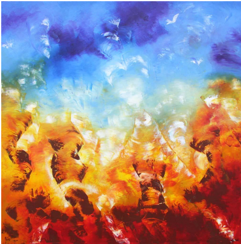
Scambio da Cuore (2014)