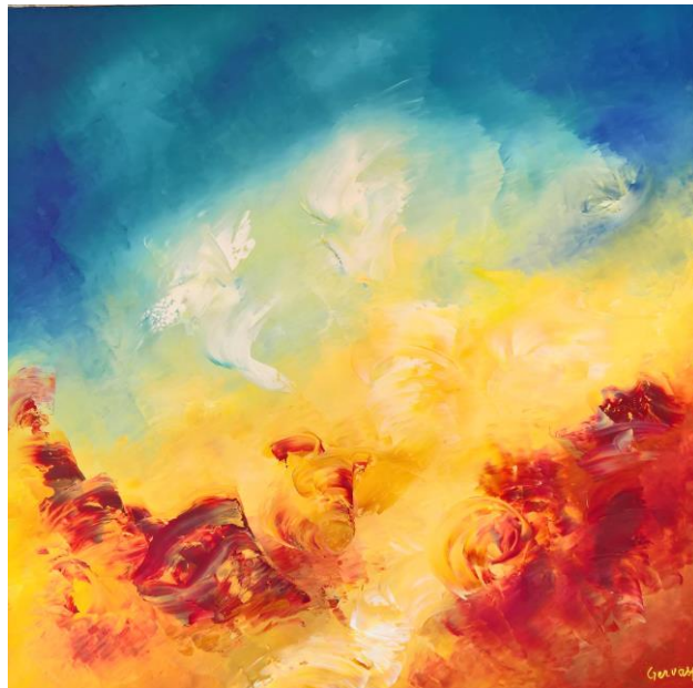
Il cielo ama la terra (2017)