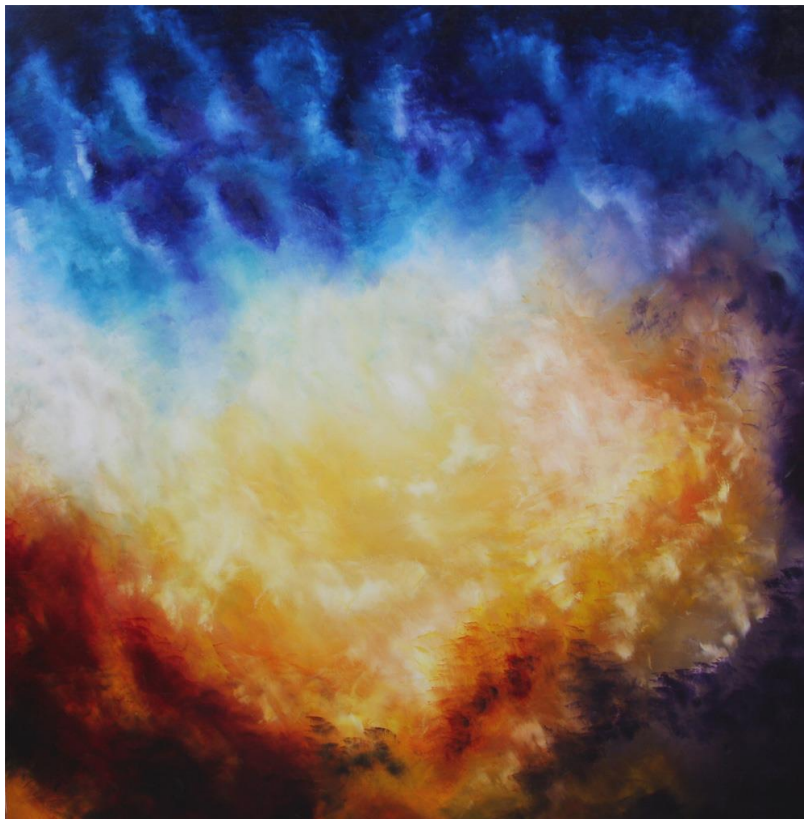
Cielo e Terra Ri-Uniti