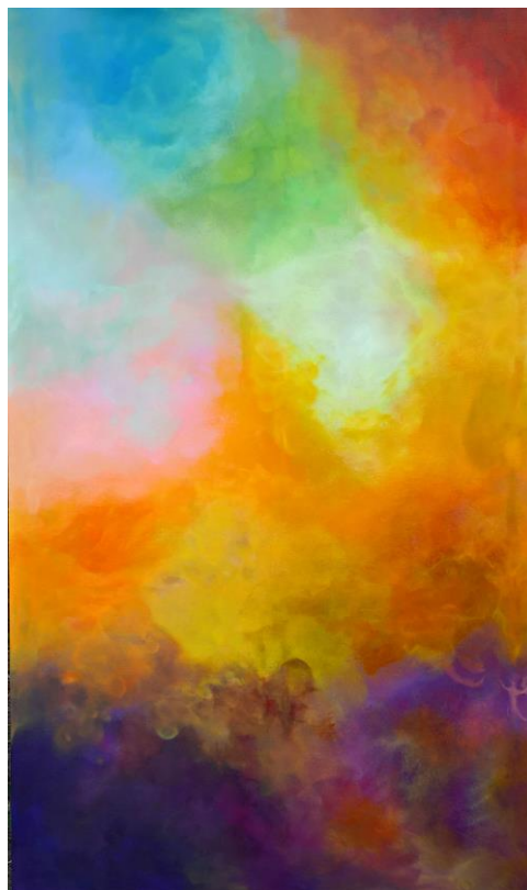
Energia Amore (2016)