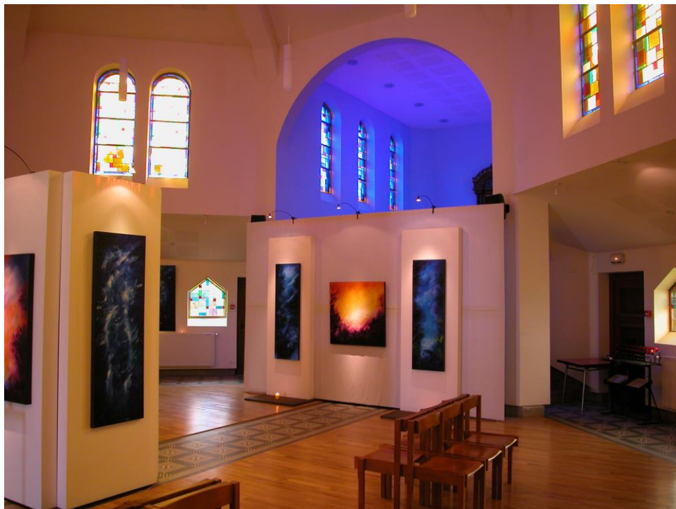
Cappella N.D. du Perpétuel Secours a Cernay (Alsazia)