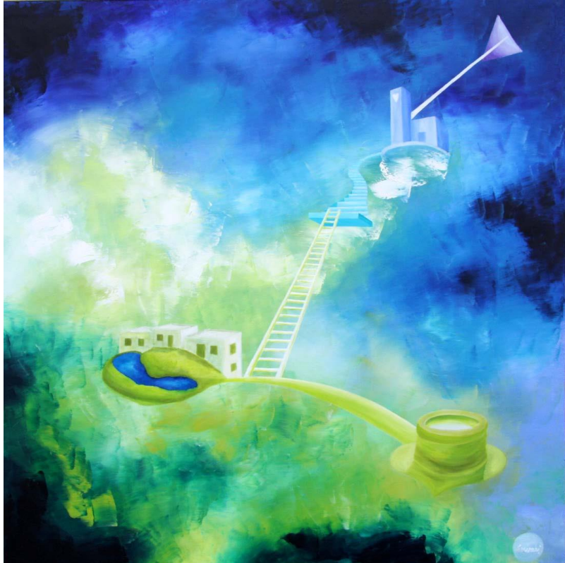
Cammino d'Elevazione (2013)