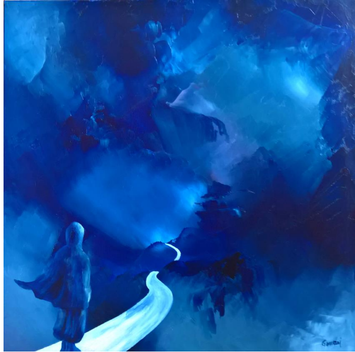
Pellegrino dell'eternità (2017)