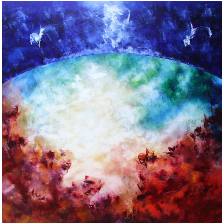
Terra e Cielo (2011)