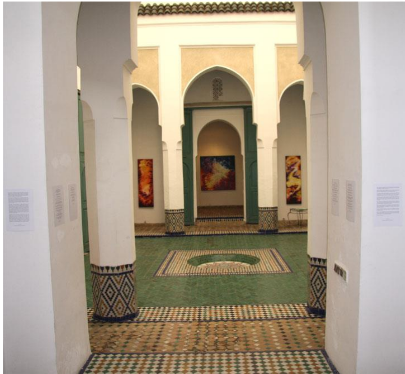
Esposizione al Museo di Marrakech